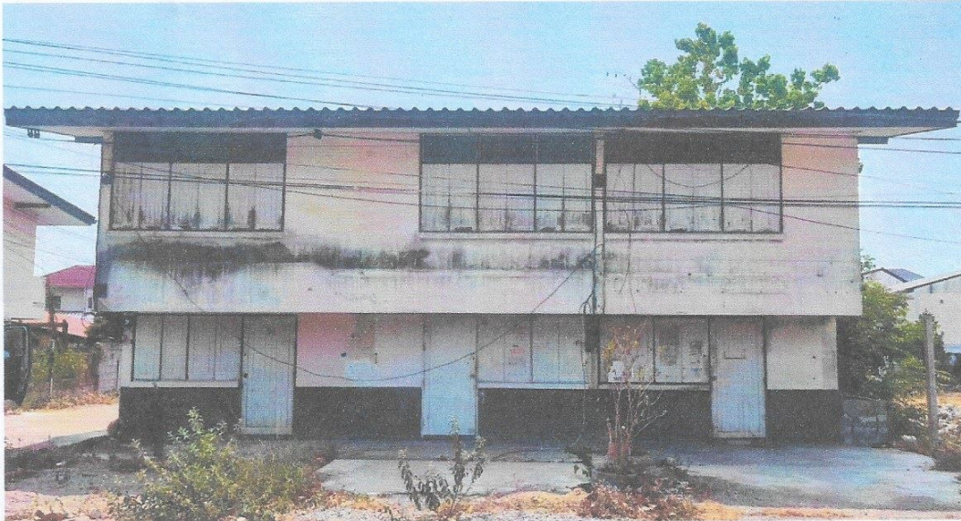
บ้านพักครูครุมิตร อำเภอหัวหิน (ธรมีสงษ์ วัดอิติสุศโต) บ้านพักเรือนแถว ๒ ชั้น จำนวน ๔ ห้อง