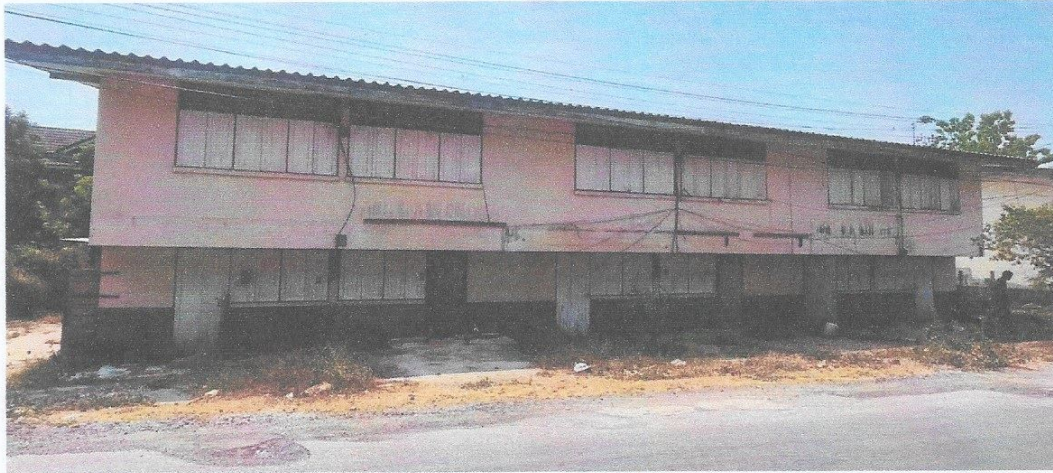
บ้านพักครูครุมิตร อำเภอหัวหิน (ธรมีสงษ์ วัดอิติสุศโต) บ้านพักเรือนแถว ๒ ชั้น จำนวน ๓ ห้อง