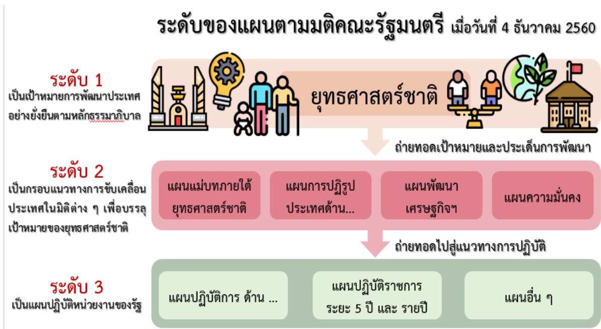
แผนภาพ ๒.๑ ระดับแผนตามมติคณะรัฐมนตรี วันที่ ๔ ธันวาคม ๒๕๖๐

๖. ยุทธศาสตร์ชาติด้านการปรับสมดุลและพัฒนาระบบการบริหารจัดการภาครัฐ มีเป้าหมายการพัฒนาที่สำคัญเพื่อปรับเปลี่ยนภาครัฐที่ยึดหลัก “ภาครัฐของประชาชนเพื่อประชาชน และประโยชน์ส่วนรวม”